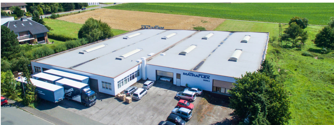
Unser Werk im lippischen Detmold

Die generationsübergreifende Geschäftsführung und langjährig erfahrene Betriebsleitung freut sich auf neue erfolgreiche Kundenbeziehungen und spannende Herausforderungen.